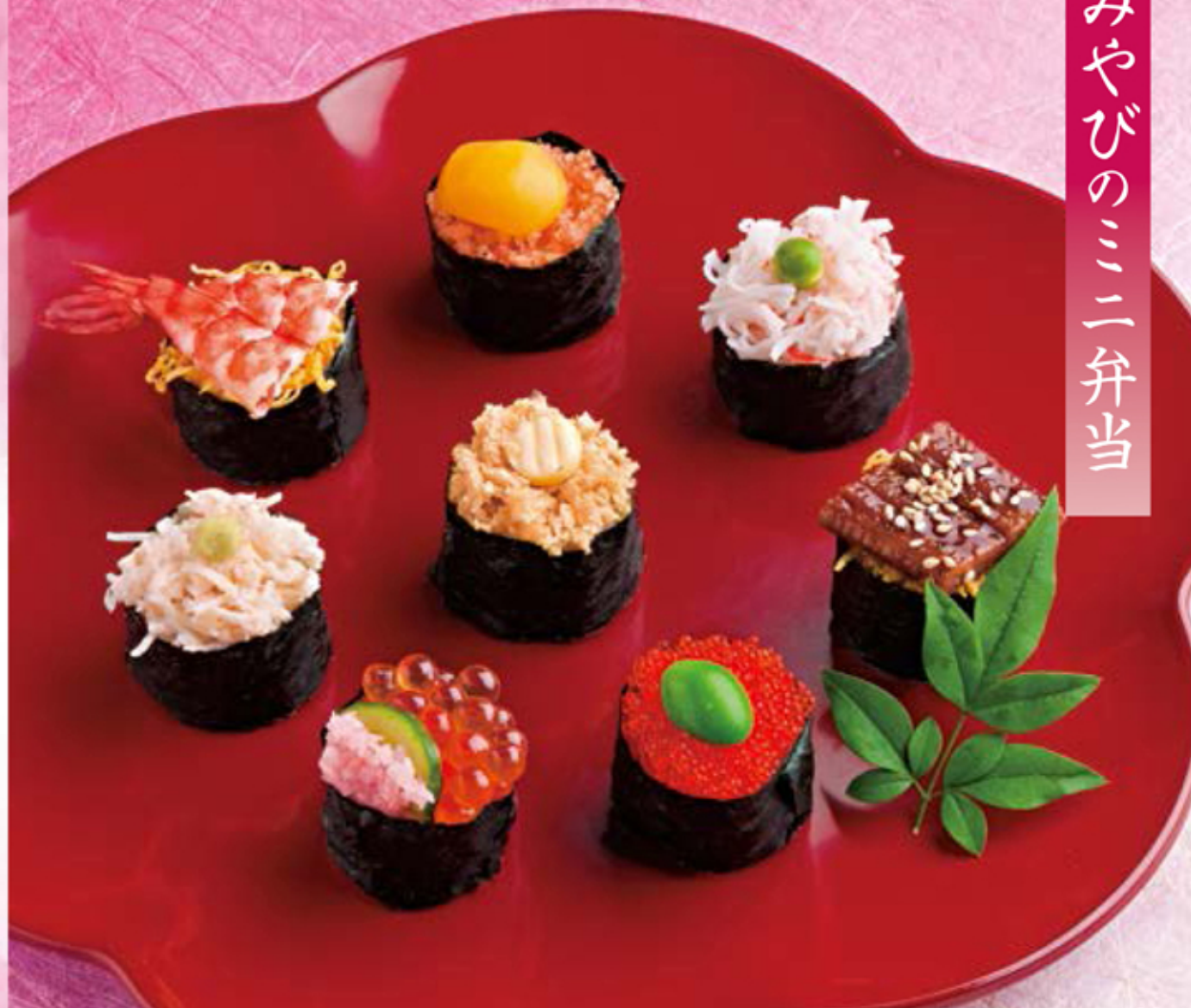
写真は、ミニ花つづり

ロングセラーの松花堂弁当「黒門」を、華やかさはそのままにミニサイズで。量は少なくあれこれ召し上がりたい方に。