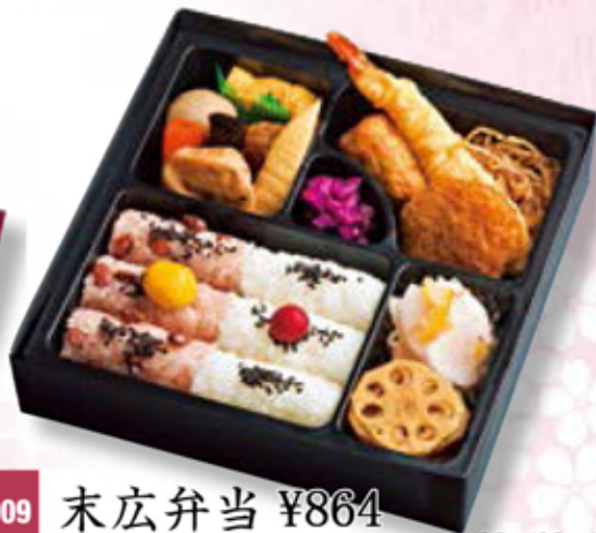
19.5 × 19.5 × 4.5cm

創業以来のロングセラーが内容を一新！伝統の良さを残しつつ、これからも末永く愛される幕の内弁当に。