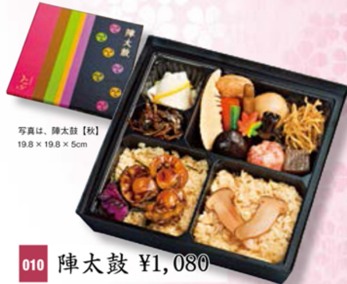
写真は、陣太鼓【秋】 19.8 × 19.8 × 5cm

炊き込みご飯の素を発売する程、人気のご飯が三種類も楽しめて、様々なお料理も入った欲張りなお弁当。