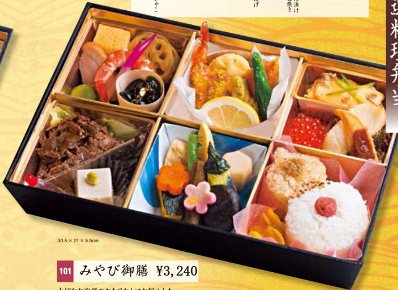
30.5 × 21 × 5.5cm