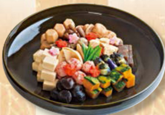
452 煮物盛合せ ¥5,184

本格江戸前天麩羅の店を持つ、みやびならではの天麩羅盛合せ。ご予算に応じてお作りします。※写真は5~6人前。