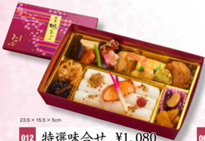
23.5 × 15.5 × 5cm

金色の華やかなお箱に、煮物・焼物・揚げ物をすべて盛り込んだ代表作の一つ。その名の通り「花」のあるお弁当です。