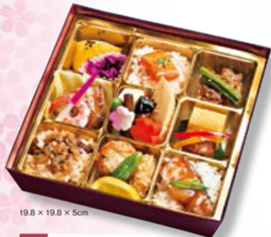
19.8 × 19.8 × 5cm