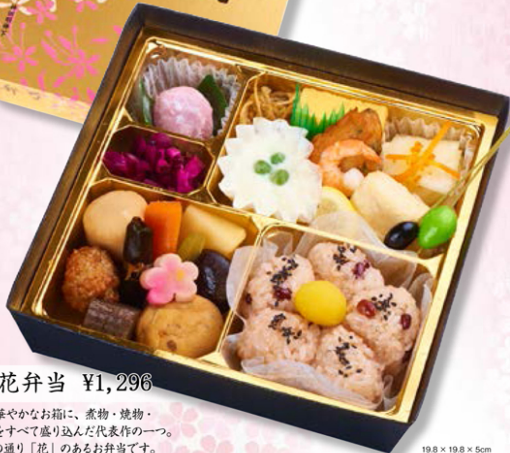
19.8 × 19.8 × 5cm