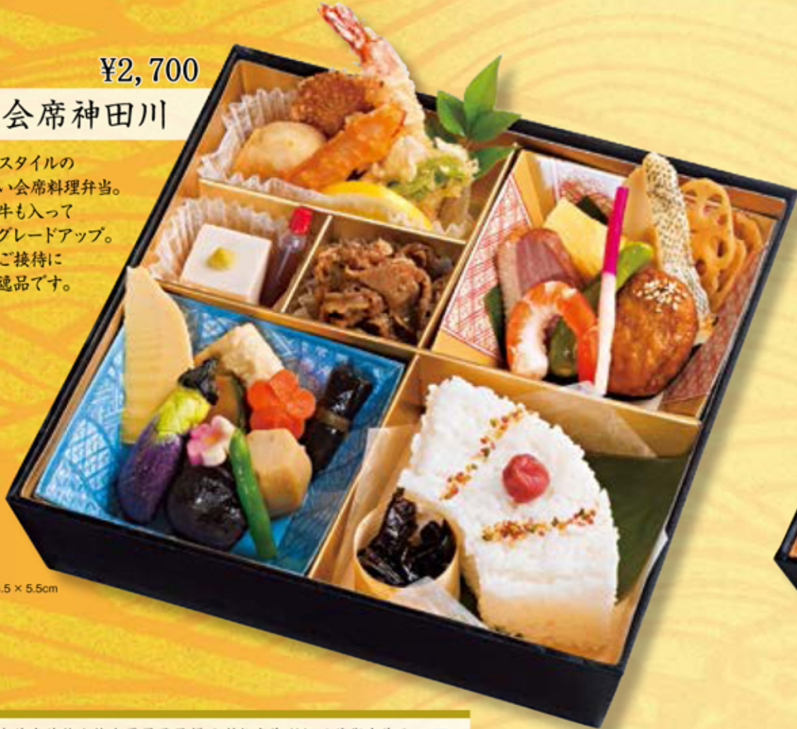
24.5 × 24.5 × 5.5cm

大切なお客様のおもてなしにお勧めしたい、お弁当の最高峰。吟味した自慢の料理を、華やかに盛り込みました。