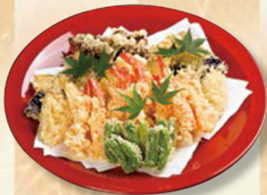
454 天ぷら盛合せ ¥6,480

寿司職人を抱えるみやびでは、江戸前寿司もお届け出来ます。8,000円以上で、ご予算に応じてお作りします。※写真は5~6人前。