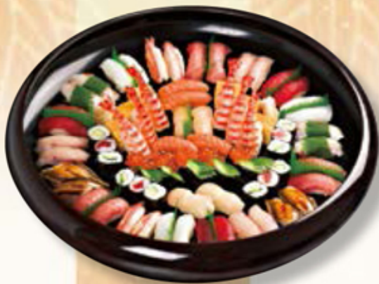
451 江戸前盛合せ ¥10,800(3台以上)

お集まりの機会に華を添える、お刺身の盛り合わせ。8,000円以上で、ご予算に応じてお作りします。※写真は5~6人前。