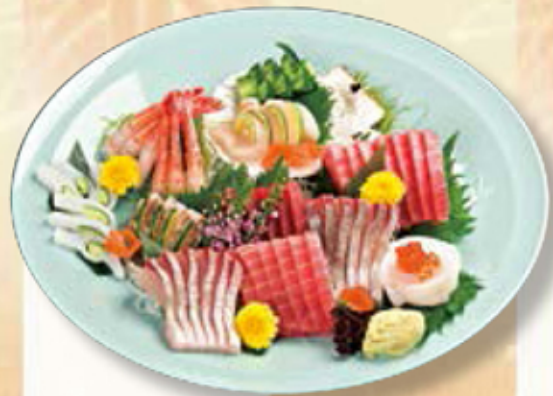
453 刺身盛合せ ¥10,800(3台以上)

お集まりの機会に華を添える、お刺身の盛り合わせ。8,000円以上で、ご予算に応じてお作りします。※写真は5~6人前。